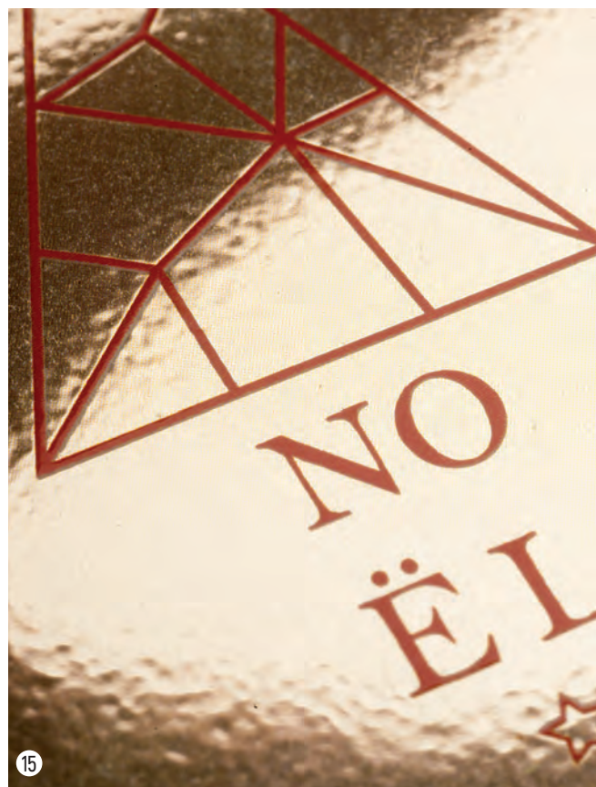
12 Carte gaufrée - 8,5 x 5,4cm - 350g couché demi-mat - pelliculé recto mat - 13 Carte double finitions - 10 x 15cm - 350g couché demi-mat - Pelliculage mat Soft Touch + vernis sélectif 3D et dorure à chaud - 14 Carte perforée - 8,2 x 12,8cm - 350g couché demi-mat - Perforation diamètre 4mm - 15 Carte papier métallisé or - 8,5 x 5,4cm - 350g papier métallisé or verso blanc